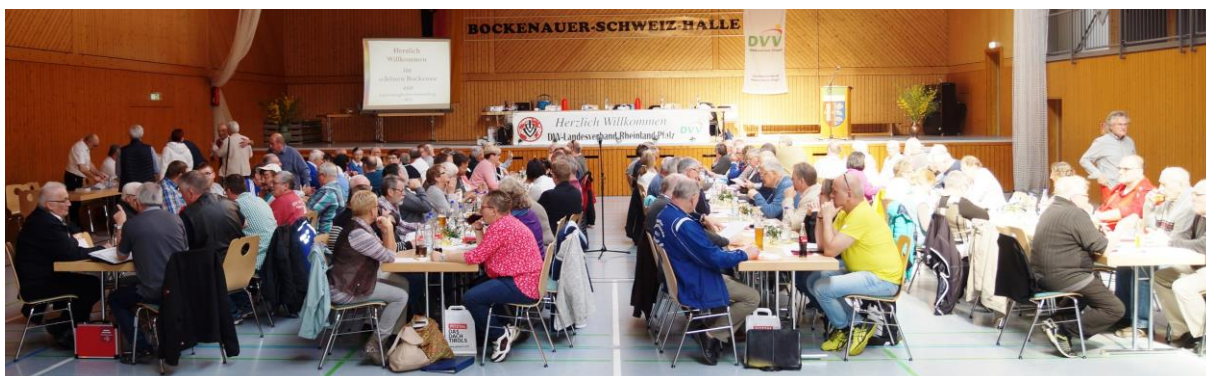
Die Landesmitgliederversammlung 2019 des DVV Landesverbandes Rheinland-Pfalz