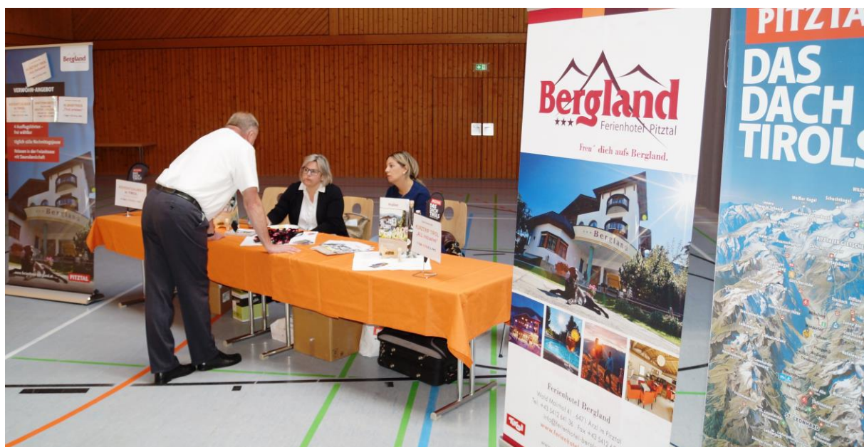
Der Tourismusverband Pitztal war wieder mit einer Ausstellung präsent.

Die nächste Landesmitgliederversammlung wird am Sonntag, den 15. März 2020 in Ramstein ausgerichtet.