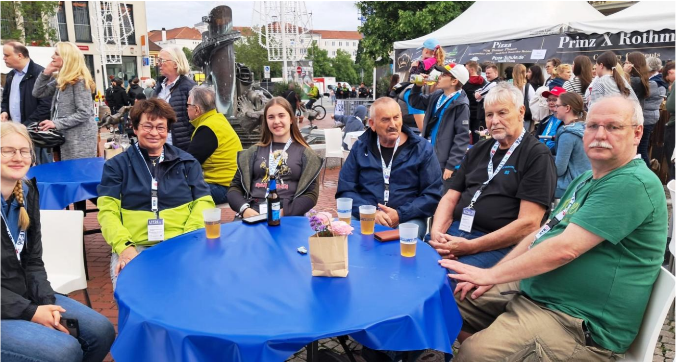
Der TV Laasphe 1863 und der TV Hahnenbach 1961 bei der Eröffnungsfeier in Hamm.