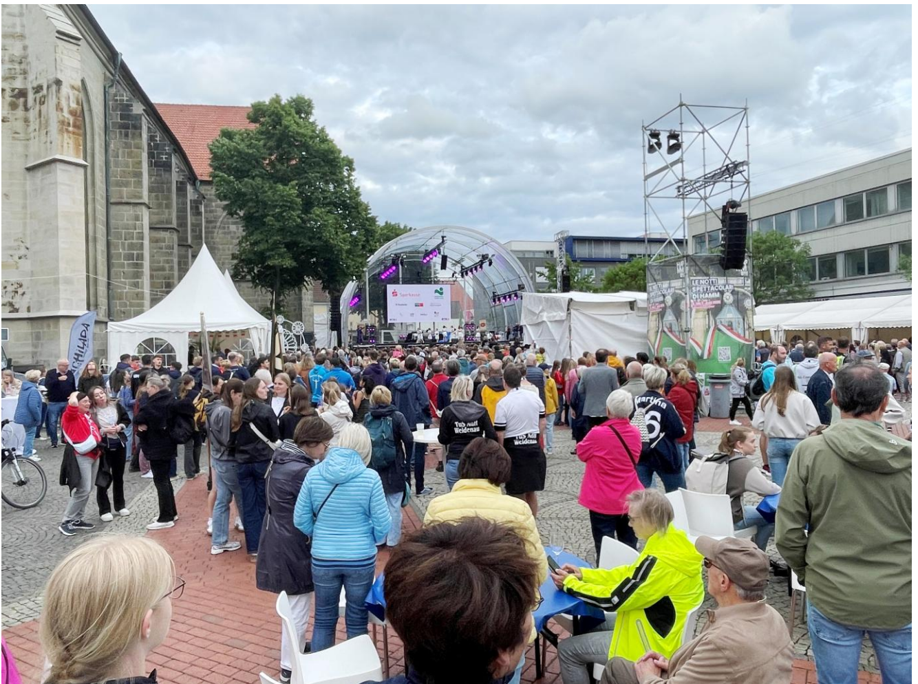
Neben der Ev. Pauluskirche in Hamm hatte man eine große Showbühne aufgebaut.