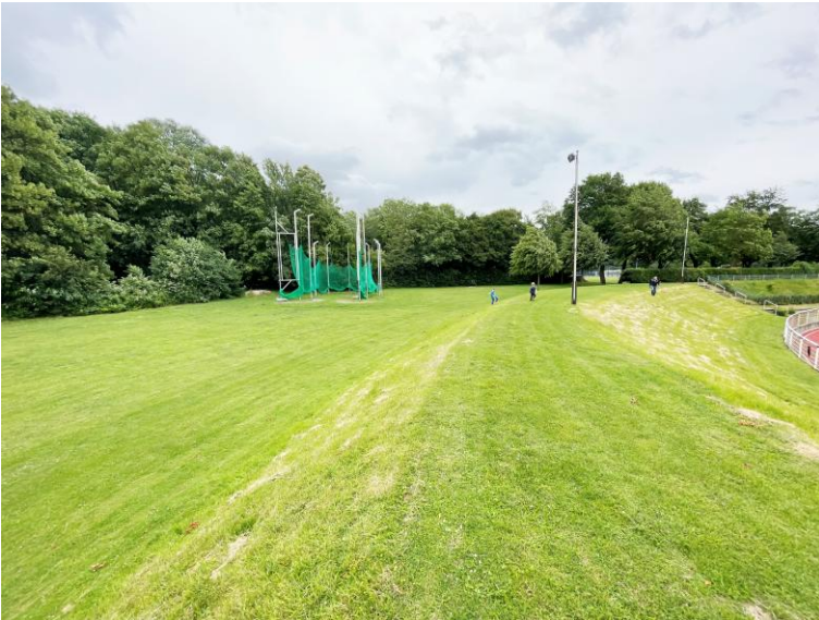
Die Hammerwurf- und Diskus-Anlage in Hamm.