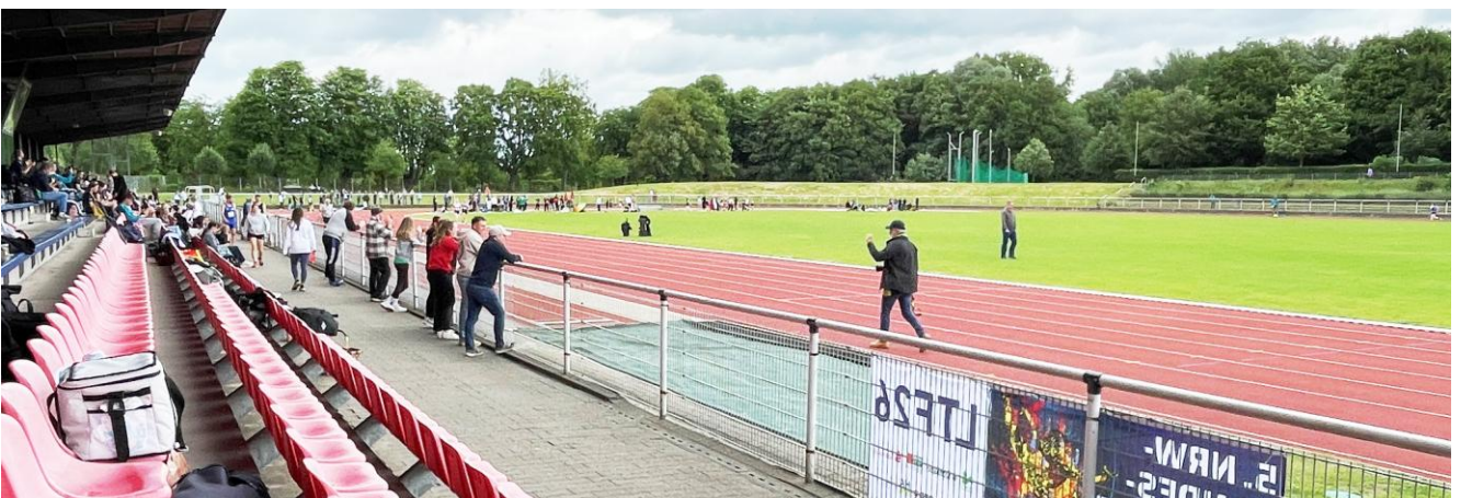
Über die 100 m Strecke standen 8 Laufbahnen zur Verfügung.