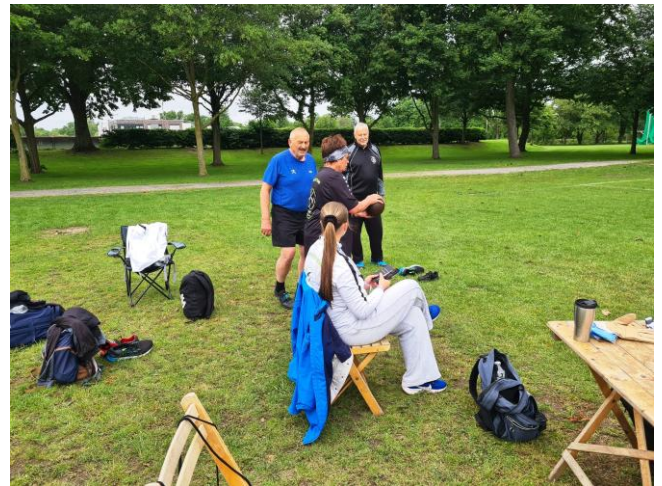
Die Athleten bei der Vorbereitung zum Schleuderballwurf.