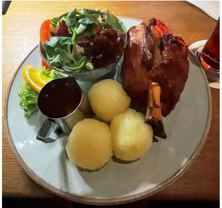
Für Willi gab es einen kleinen Teller. Während sich Rolf an der Schweinshaxe labte.