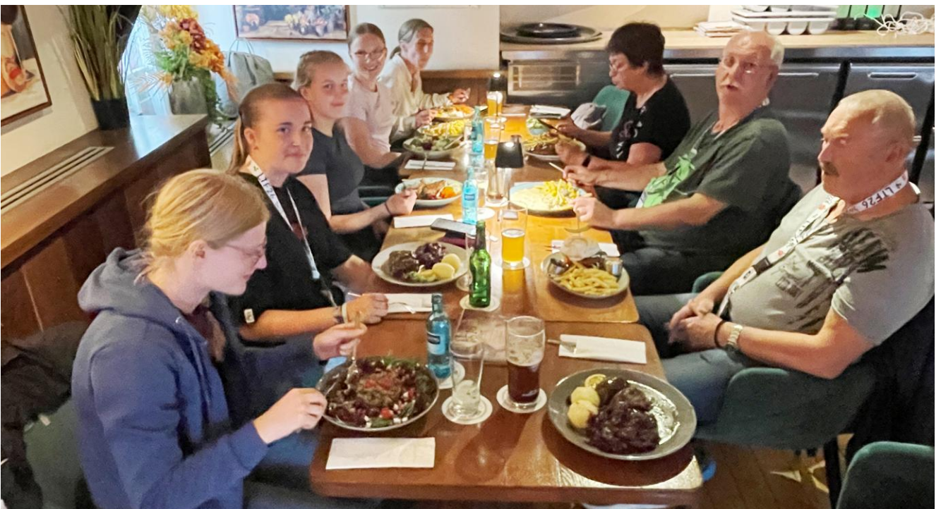
Nachdem Wettkampf wurde erholte man sich im Hammer Brauhaus.