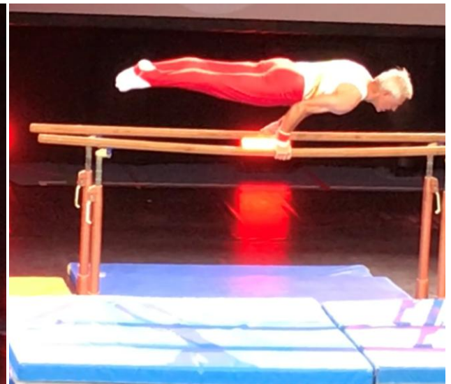
So Fit kann man mit 82 Jahren sein.