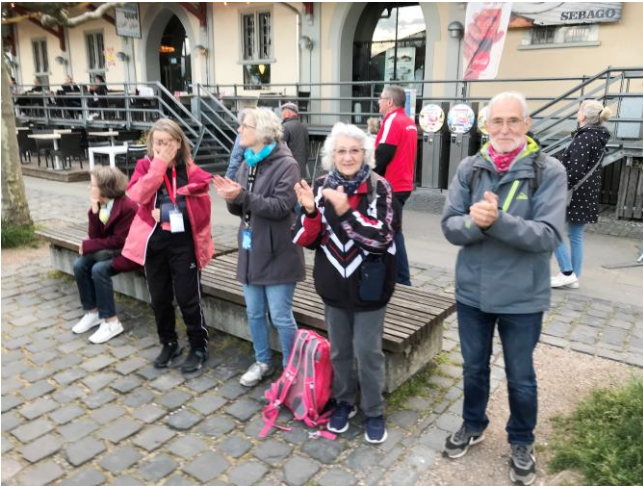
Viel Beifall gab es entlang des Umzugs.