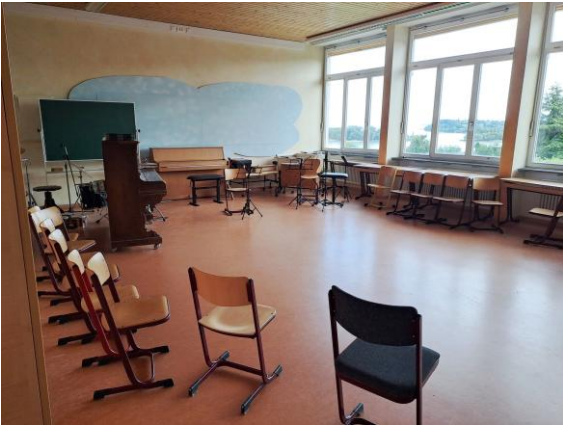
Aus dem Musikzimmer hatte man einen schönen Blick auf die Insel Mainau.