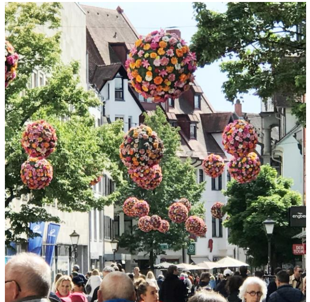
Konstanz mit seiner Blütenpracht.