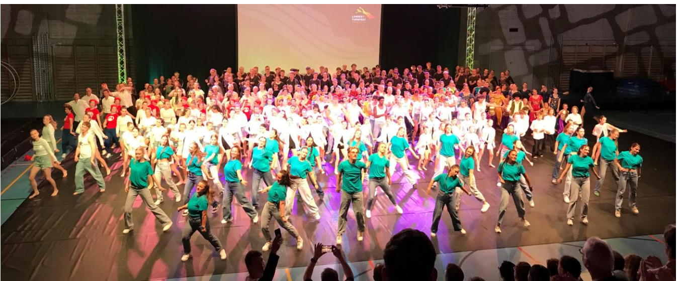
Alle Teilnehmer an der Turngala tanzten zum Abschluss für die 1.000 Zuschauer.

Auf dem Programm der Hahnenbacher stand noch am 16.05.2026 um 11:00 Uhr das 3 Stündige „Rendezvous der Besten“ und um 17:00 Uhr die Veranstaltung „Grüezi Turnen“.