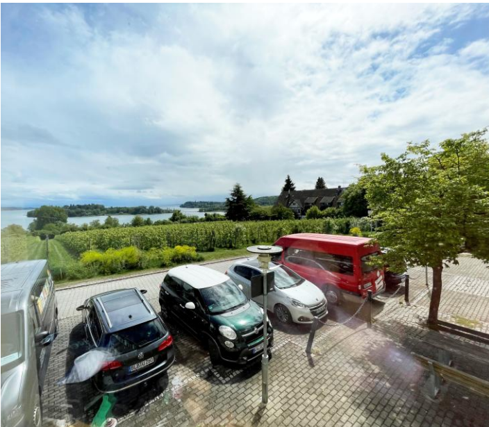
Herrlicher Blick auf die Insel Mainau.

Das Musikzimmer, in der Grundschule in Litzelstetten (Ruheschule) in Großherzog-Friedrich-Straße 12, in D-78465 Konstanz, war für die 4 Aktiven vom TV Hahnenbach, den 3 jungen Damen aus Bayern und Uwe Born vom TV Laasphe 1863, die Unterkunft während des Landesturnfestes in Konstanz.