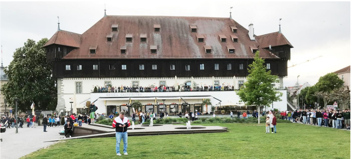
Der Festzug führte vorbei am berühmten Konzil, mit der Ehrentribüne, in Konstanz.