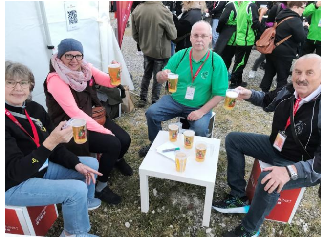
Ein kühler Trunk zum Abschluss.

Besuch der Turngala in der Dreispitz-Halle in (CH) Kreuzlingen am 14.05.2026.