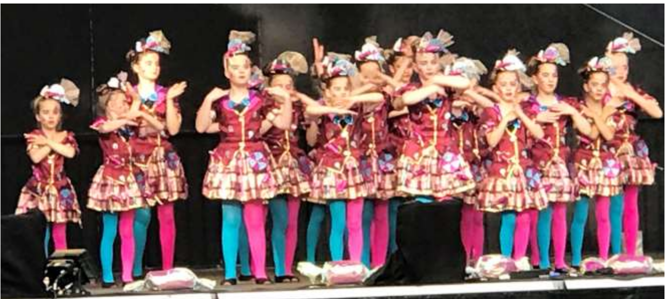
Auf der Showbühne des Turnfestzentrums beginnt das Sportprogramm.