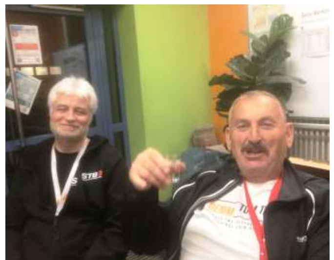
Bevor es jedes Mal zu Bett ging, gab es noch einen kleinen Plausch im Hausgang.