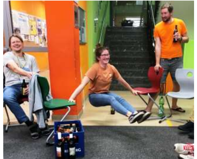
Turner/Innen finden immer ein Turngerät um Übungen durchzuführen.