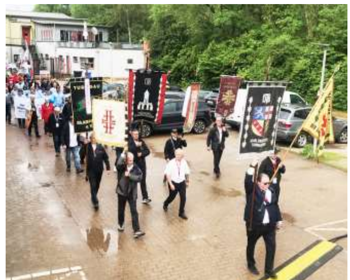
Festumzug anlässlich des 21. Saarländischen Landesturnfestes in Völklingen 2024.