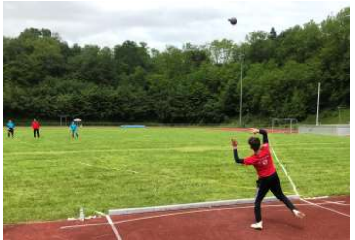
jeweils beim Schleuderball