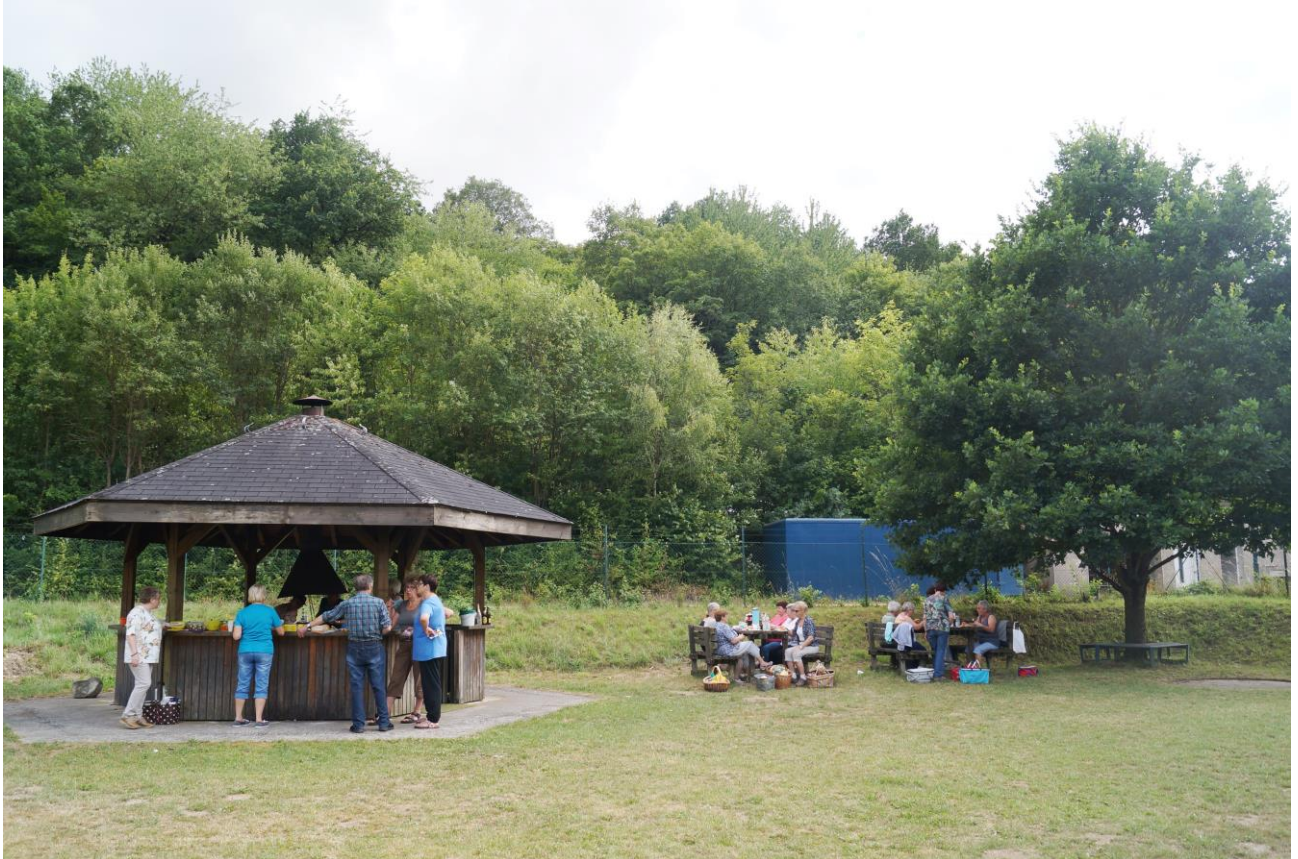
Grillen an der „Berliner Turnfesteiche von 1987“ steht bei den Mitgliedern des Turnvereins Hahnenbach hoch im Kurs