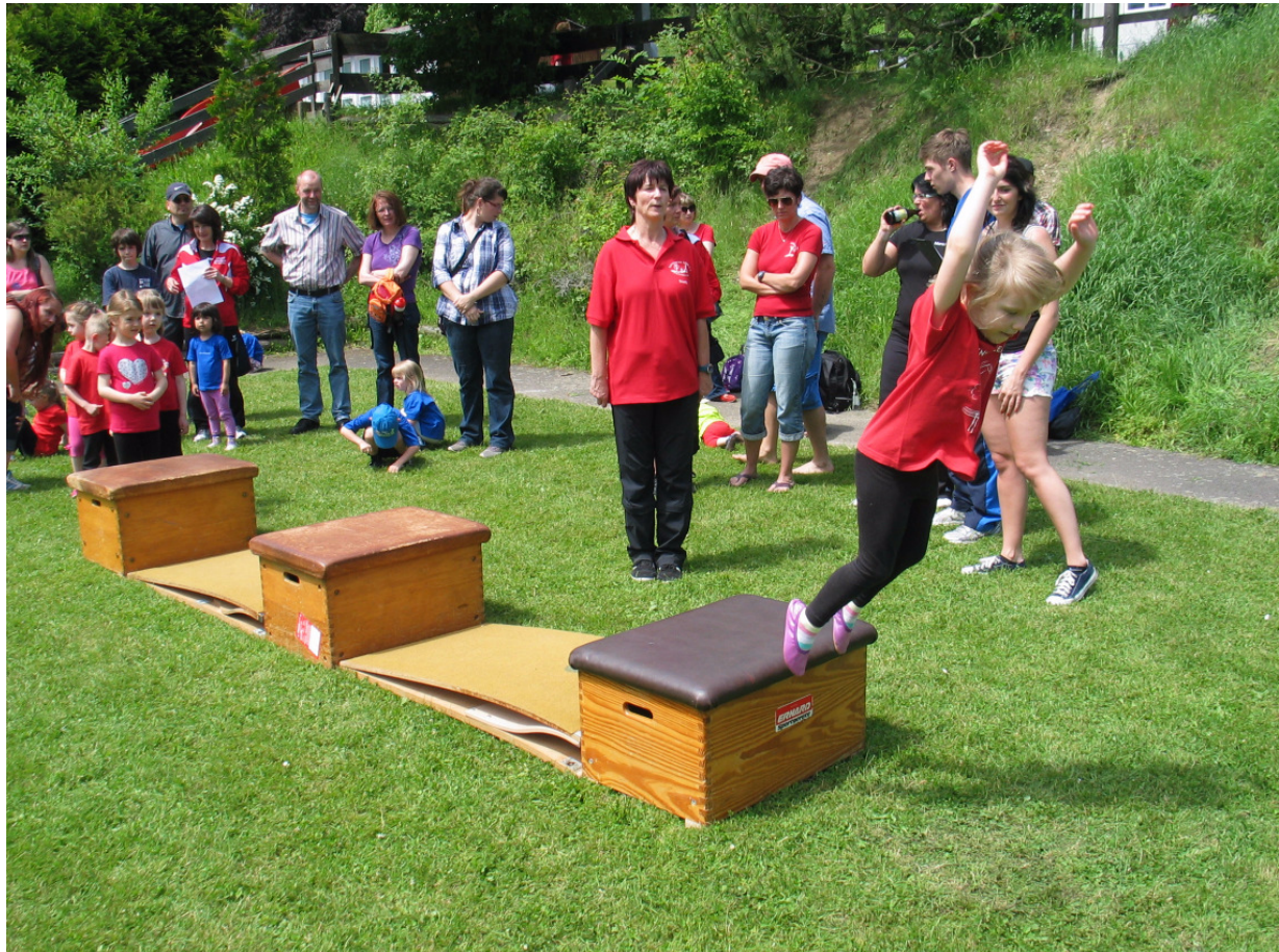
Das Team des TV Hennweiler bei ihren Kastensprüngen

Für die Kinder aus Hahnenbach wäre es auf jeden Fall wünschenswert, den ein sportlicher Vergleich ist immer das größte Erlebnis, vor allem wenn man gesehen hat, mit wie viel Spaß und Eifer die Kids bei der Sache waren.