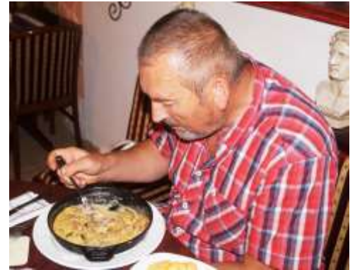
Beim Griechen in Halberstadt stärkten sich die Hahnenbacher Athleten