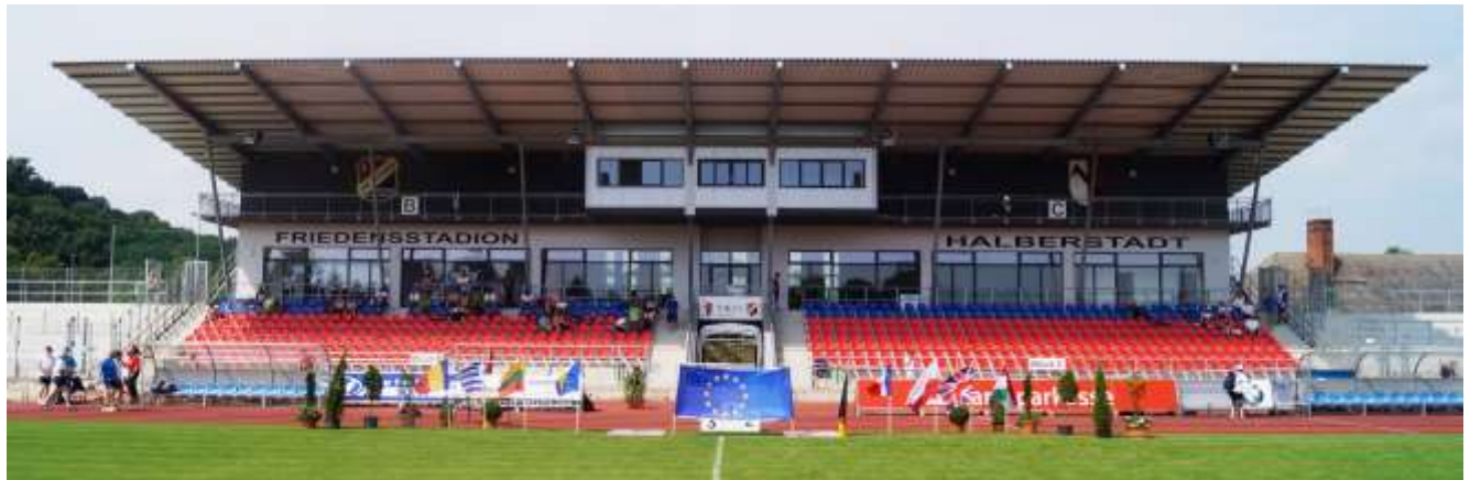
Die Tribüne des Friedensstadions in Halberstadt