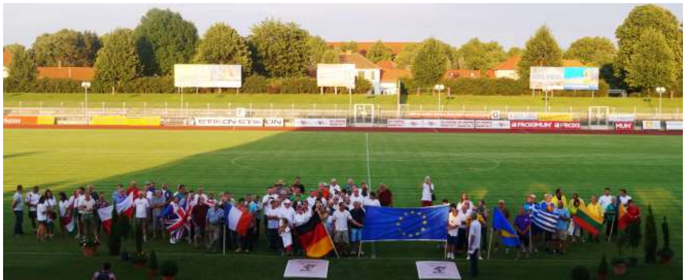
Bei der Eröffnungsfeier wurden die Fahnen der teilnehmenden Nationen ins Stadion getragen

Zum fünften Mal seit 2005 richtete Deutschland die „Werfer-Europameisterschaften 2014“ des LSW-Spezialsportes aus, an der ca. 250 Aktive aus Bosnien-Herzegowina, Frankreich, Großbritannien, Griechenland, Litauen, Österreich, Polen, Rumänien, Russland, Ungarn und Deutschland teilnahmen. Das die Vorbereitungen, mit vier durchgeführten eigenen LSW-Sportfesten, für die Hahnenbacher Athleten optimal und passgenau waren zeigte sich an der Ausbeute der Medaillen, welche für Deutschland gewonnen werden konnten. Neben Gitta Jung, die in ihrer Altersklasse W-65