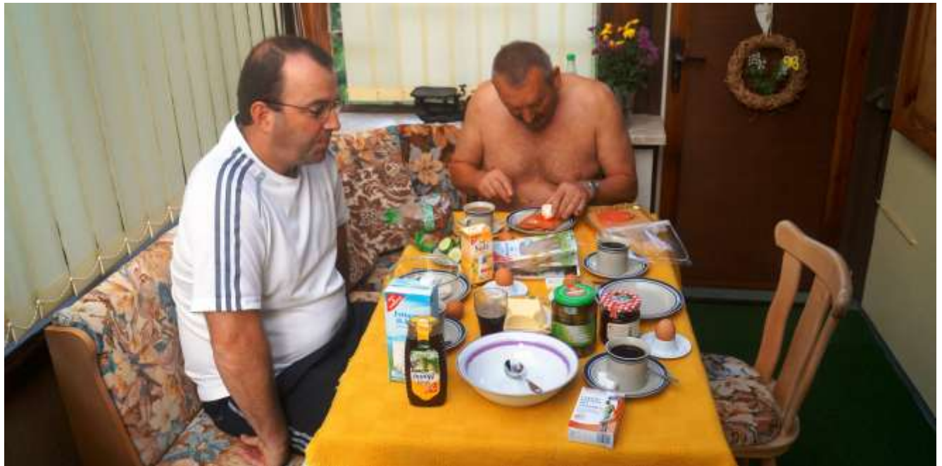
Auch beim Frühstück war der Tisch immer reichlich gedeckt