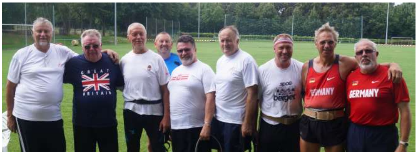
Bei den 60-jährigen starteten Athleten aus Ungarn, Großbritannien, Polen und Deutschland